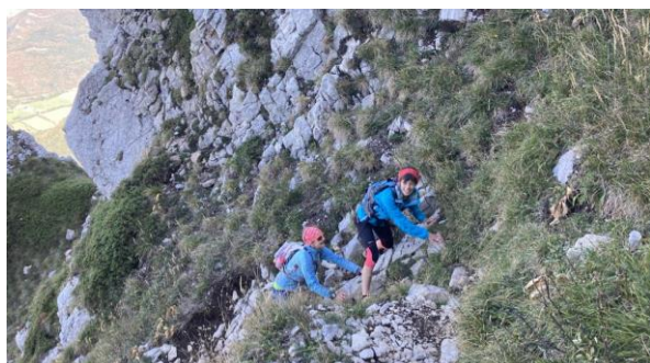
Trail à la Grande Sure le 18 septembre (sortie en mobilité douce)