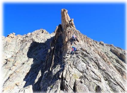
Arête sud Dibona 18 septembre 2022