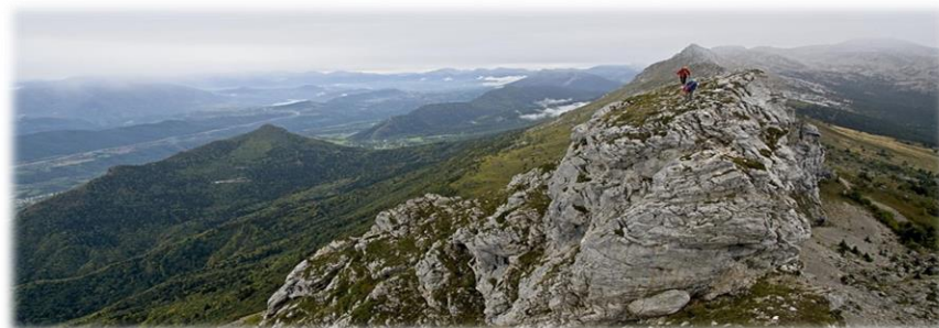
Groupe Autonomie alpinisme au Cornafion le 1 er octobre