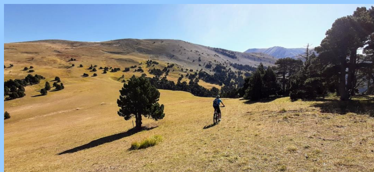
VTT : ils enchaînent les cols !