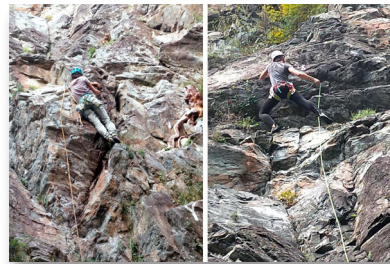
Couennes Alpes du Nord (Romanche et Vénéon)