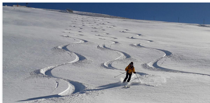
Descente du Pérolier (Taillefer)