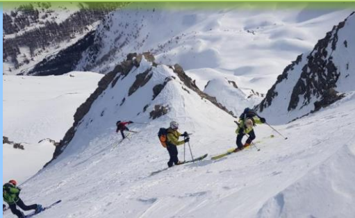
C'est raide !

Ainsi que des séances initiation, progression, et la saison n'est pas finie !